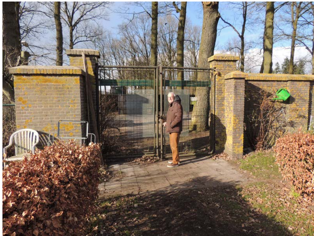
Het toegangshek aan de Boerderijlaan gezien vanaf het toegangspad voor de vereniging "Eigen Oogst". De muur werd gebouwd omstreeks 1910 en heeft verschillende toegangspoorten.