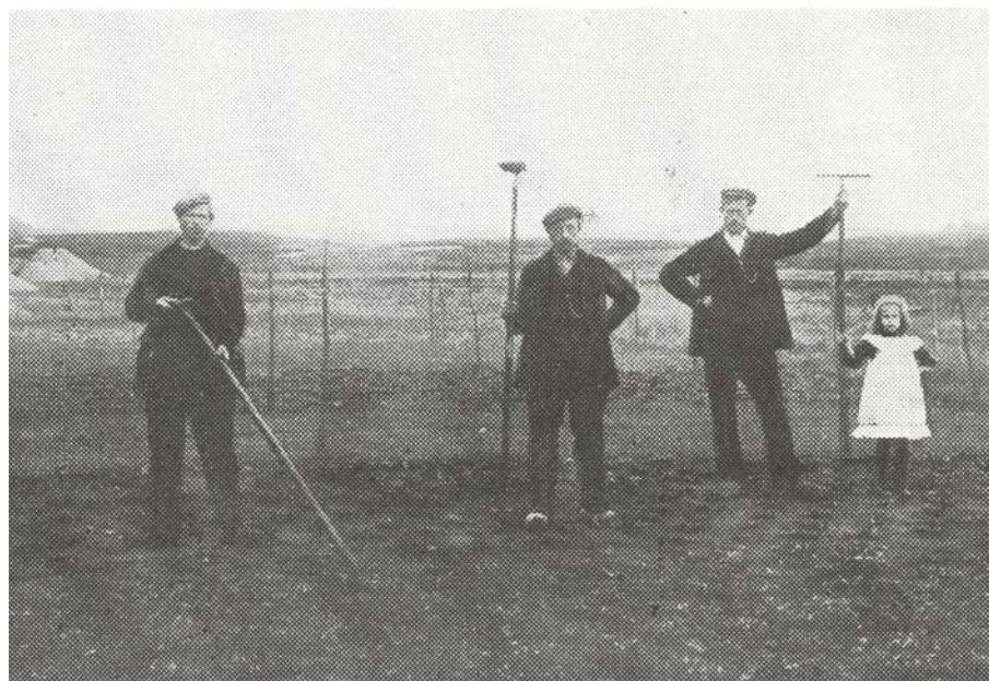
Arbeiders in de tuin, naar schatting omstreeks 1920.

In 1906 begon de Willem Arntsz Stichting in Den Dolder met het bouwen van een "Buitenkliniek". Dit vanuit de gedachte dat buitenwerk de psychiatrische patiënten therapeutisch zal helpen. Er werd een boerderij met weilanden, landerijen en een moestuin van 2 ha aangelegd. Met de aanleg van de moestuin is omstreeks 1910 begonnen. Het juiste aanvangsjaar