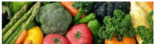
Tuinvereniging Eigen Oogst