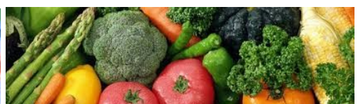
Tuinvereniging Eigen Oogst