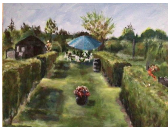
Illustratie: Jetty Liezenberg

Twee bestuursleden en een lid van Eigen Oogst hebben deelgenomen aan de informatiebijeenkomst over de herontwikkeling van de WA-Hoeve op 12 januari. Hoewel onze tuin geen direct onderdeel uitmaakt van deze fase van herontwikkeling is het toch goed om op de hoogte te zijn van veranderingen in de omgeving. De deelname was aanleiding om ook verder alert te blijven, de bestemmingsplannen te bestuderen en naar herontwikkelingsplannen te kijken vanuit inhoudelijke aspecten van het visiedocument van Eigen Oogst. Met name ten aanzien van natuurlijke en cultuurhistorische aspecten. De bestemmingsplannen liggen tot 16 februari ter inzage bij de gemeente Zeist. Het bestuur komt er spoedig op terug en staat open voor opmerkingen.